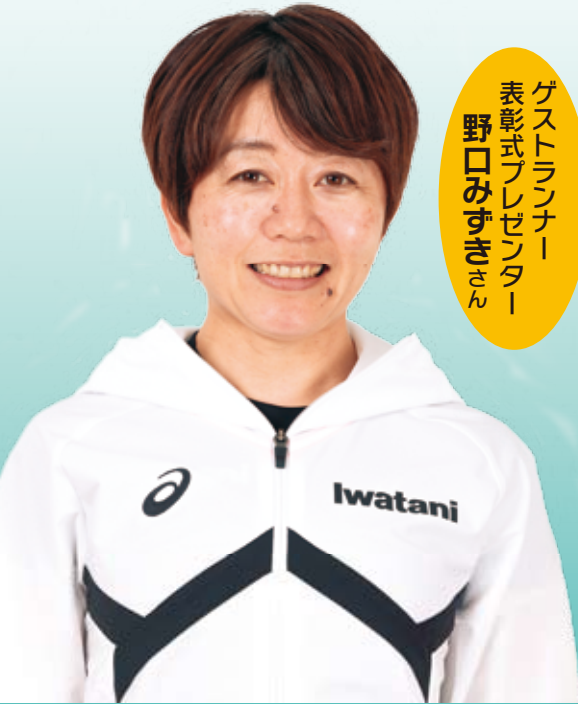
ゲストランナー 表彰式プレゼンター 野口みずきさん